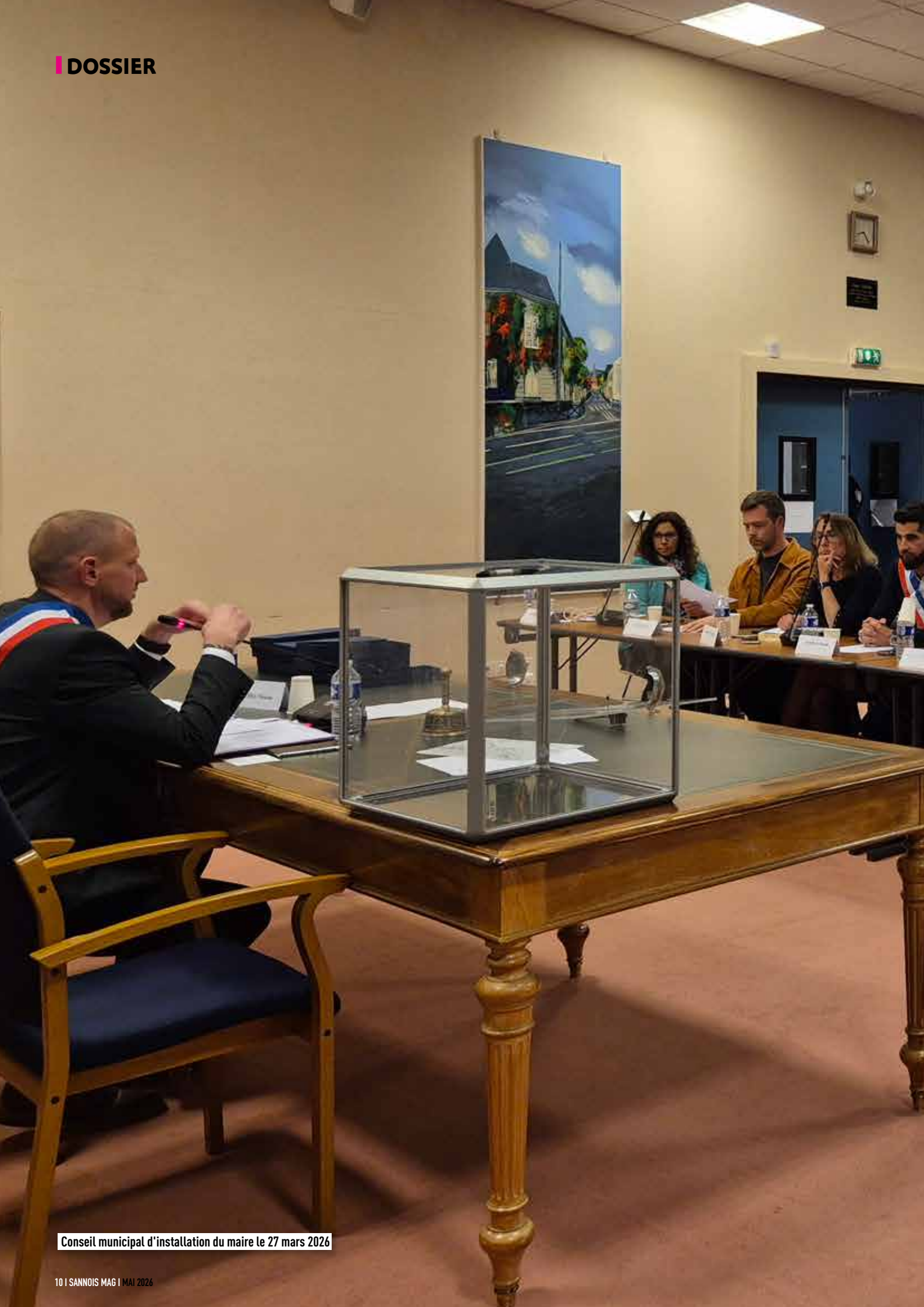
Conseil municipal d'installation du maire le 27 mars 2026