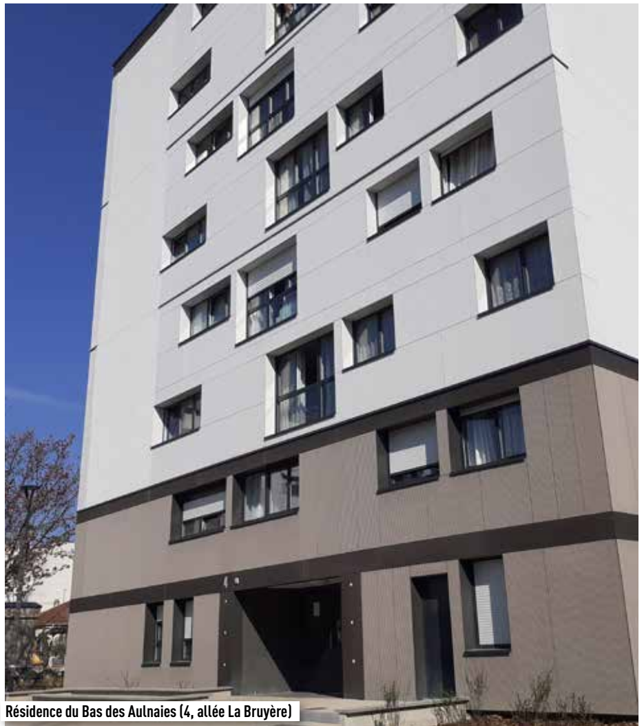
Résidence du Bas des Aulnaies (4, allée La Bruyère)

Pour le bailleur, ce type d'initiative représente à la fois une amélioration concrète du patrimoine et un investissement social durable sur le territoire, en résonance avec le programme de renouvellement