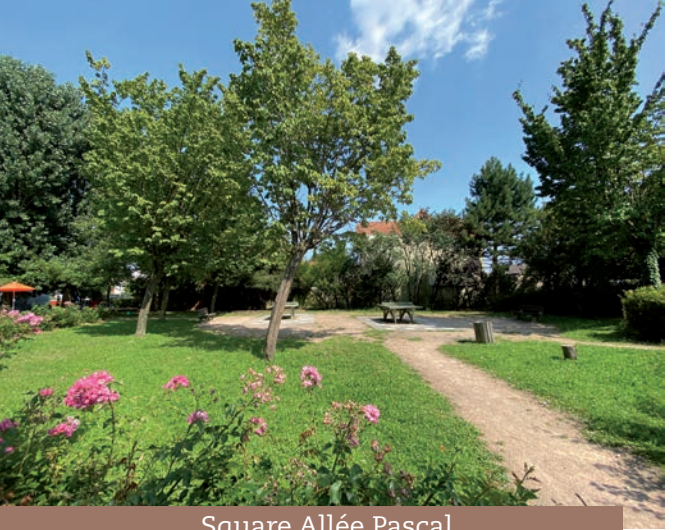
Square Allée Pascal