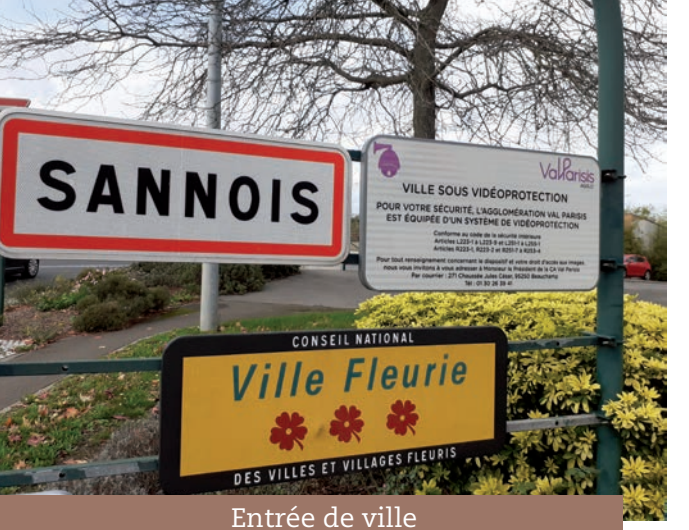
Entrée de ville