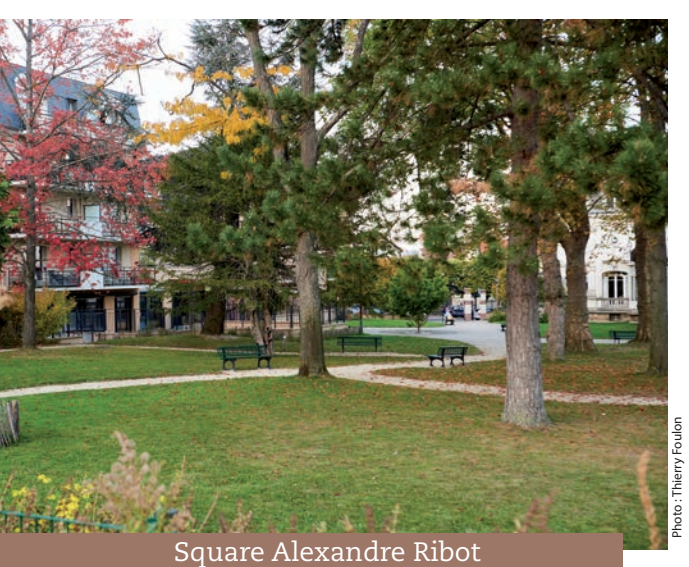
Square Alexandre Ribot