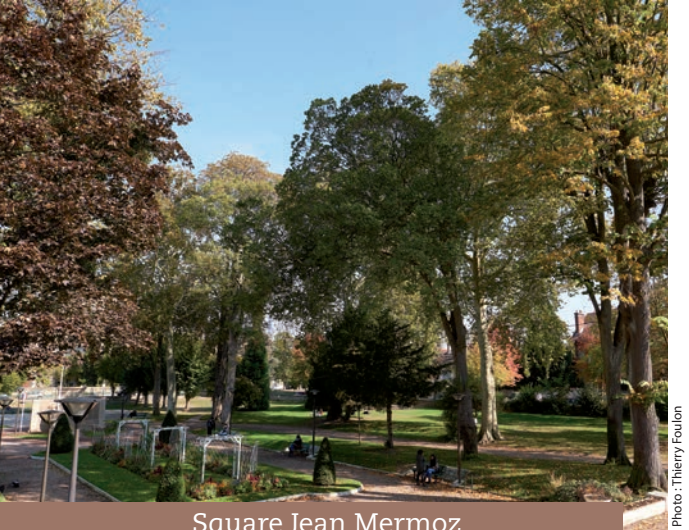
Square Jean Mermoz