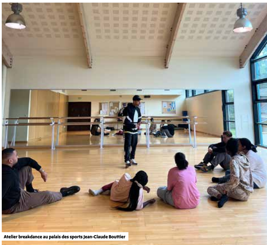
Atelier breakdance au palais des sports Jean-Claude Bouttier

Ces ateliers envers les jeunes seront complétés, dans le cadre du projet de L'Art du collectif, par une action à destination des artistes locaux accompagnés par l'EMB. Il s'agira d'une rencontre