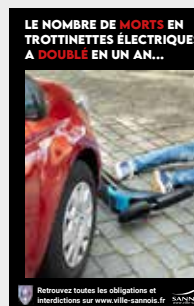
Reportez toutes les obligations et inscriptions sur www.ville-sannois.fr

Afin de sensibiliser les habitants aux risques encourus par l'utilisation de la trottinette électrique, la ville de Sannois a lancé une campagne d'affichage insistant sur le nombre de morts qui a doublé en un an. Un message