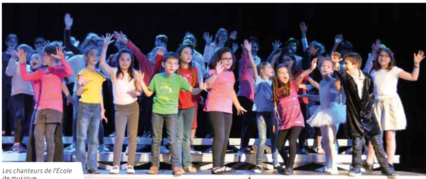
Les chanteurs de l'École de musique