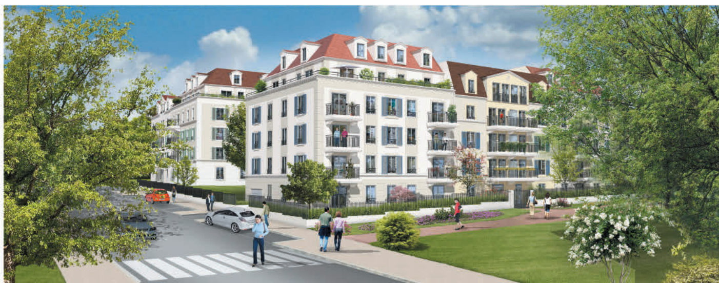
Première tranche de travaux : construction de 84 logements (quartier de l'église).