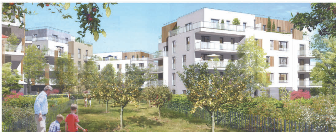
Construction d'un écoquartier de 270 logements. Aménagement d'un nouveau stade en pelouse synthétique, d'un parcours cycliste, d'aires de jeux et de terrains de pétanque.