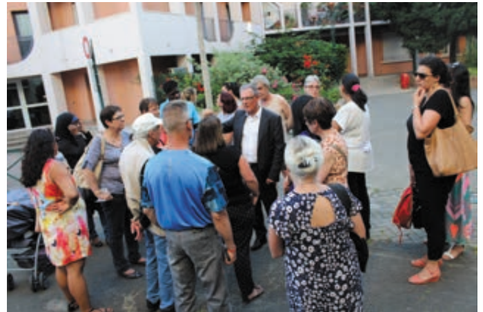
Des administrés attentifs aux propos de Monsieur le Maire sur l'avenir de leur quartier (Loges-Gambetta)

Cette visite de quartier a rassemblé de nombreuses personnes désireuses de partager avec l'équipe municipale, des problèmes de vie quotidienne dans leur quartier respectif. L'équipe technique a enregistré les données des contacts pris lors de la visite, et des retours seront programmés afin d'apporter des réponses aux différentes doléances.