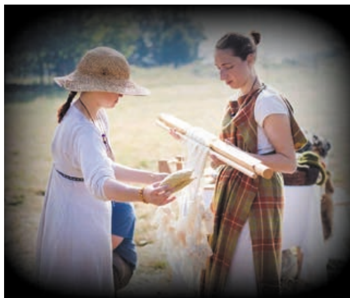
Ci-dessus : Journée des Associations