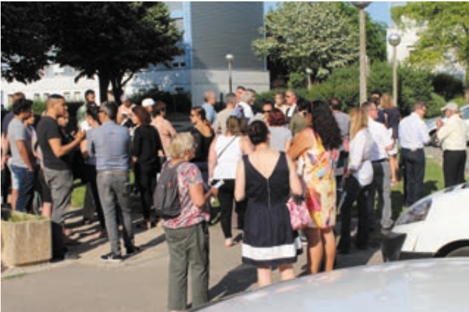
De nombreux citoyens sont venus à la rencontre du Maire (quartier du Bas des Aulnaies)

L'angle de la rue des frères Kegels et du boulevard de Lattre de Tassigny a marqué l'avant-dernière étape de la visite, lieu qui sera visé par une sécurisation des circulations (école Gaston Ramon). Enfin, l'étape finale, située rue des pavillons, fera l'objet d'un aménagement ponctuel de la signalisation, d'une sécurisation des circulations, et d'opérations d'entretien de voirie.