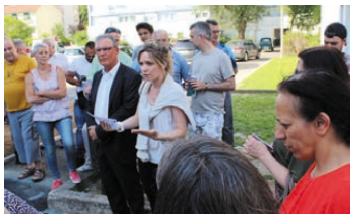
Une urbaniste de bureau d'études présente les projets du quartier du Bas des Aulnaies

La visite du quartier s'est poursuivie par un arrêt à l'angle de l'avenue de la Sabernaude et de la rue des Loges, où un pôle de centralité sera créé, avec des commerces de proximité et des logements. La passerelle de l'A115 marque la 6e halte, où un réaménagement de la descente piéton est envisagée, ainsi que le contrôle de fonctionnement de l'éclairage public par l'Agglo. À noter que la requalification et la mise aux normes des accès de la passerelle sont en cours.