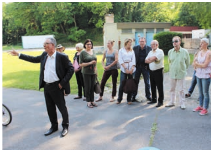
Monsieur le Maire présente le projet d'éco-quartier (stade Coutif)

L'ensemble de la délégation s'est ensuite dirigée dans le quartier des Carreaux Fleuris (rue des Fossés Trempés), dans lequel sont prévus des réaménagements des espaces verts, une possible démolition du parking silo, ainsi qu'une reconstitution des places de stationnement. Une requalification du quartier est en cours d'étude dans le cadre du protocole ANRU.