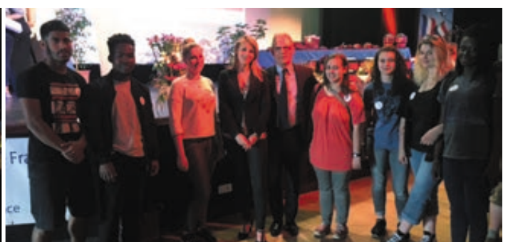
MARDI 16 MAI Remise des titres du concours départemental « Un des Meilleurs Apprentis de France » au centre Cyrano