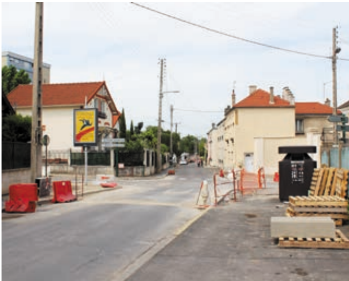
Rue de Cernay - Carrefour Magendie