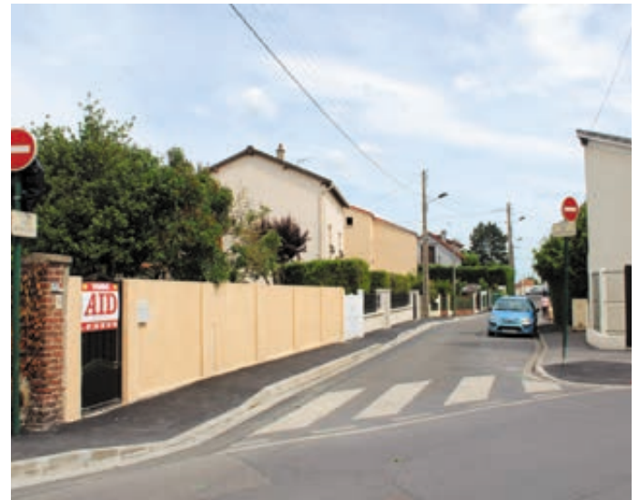
Rue des Fanouilletts

Mise aux normes accessibilité (passages PMR) des passages protégés.