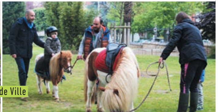
SAMEDI 6 MAI Fête de la nature et des fleurs, sur le Parvis de l'Hôtel de Ville et au square Jean Mermoz