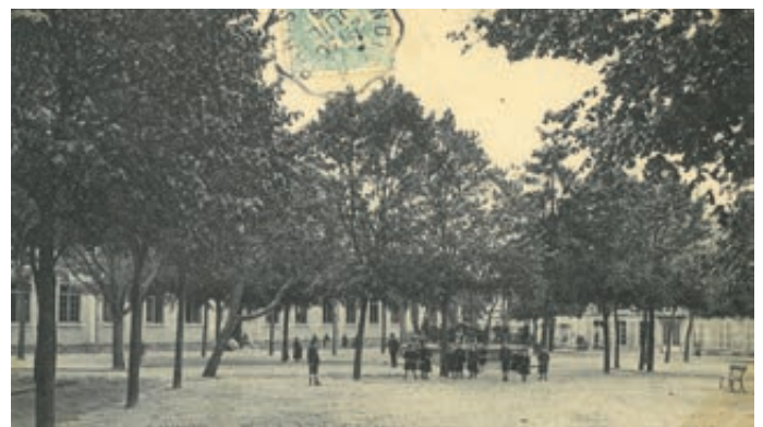
Ci-dessus à droite : Carte postale du square. On y voit au centre, au milieu des enfants qui jouent, le kiosque à musique et on devine, sous les arbres, à gauche l'école Jules Ferry et au fond l'arrière de l'ancienne mairie.