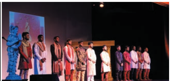
SAMEDI 13 MAI Election de Miss et Mister India France au Centre Cyrano