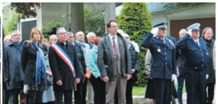
LUNDI 8 MAI Commémoration de la victoire du 8 mai 1945, Monument aux Morts, square Jean Mermoz