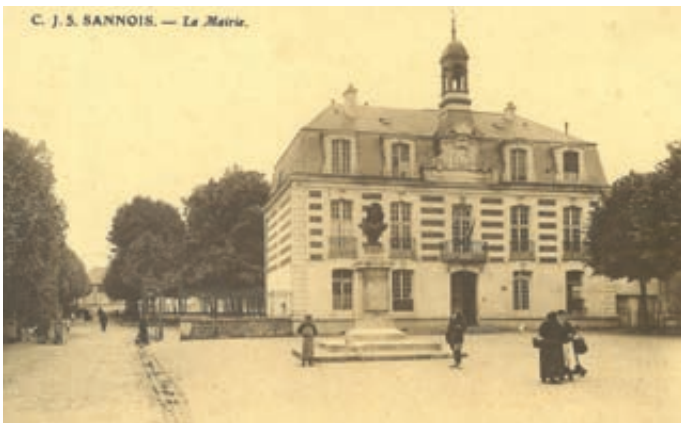
Ci-dessus à gauche : Carte postale de la mairie. On y aperçoit, à gauche, la grille marquant l'entrée du square Jules Ferry (archives municipales, cote 13W1).

La population de la ville augmentant de manière constante, l'école se trouve, à son tour, sous-dimensionnée. Il est décidé, par délibération du 17 décembre 1935, la création d'un nouvel établissement scolaire pour filles (actuellement école Henri Dunant), l'ancien bâtiment étant alors réservé aux garçons. À cette occasion, la ville acquiert de nouveaux terrains et le jardin public est alors totalement fermé et transformé en cours de récréation pour l'école Jules Ferry garçon. Le kiosque à musique est quant à lui détruit en 1946.