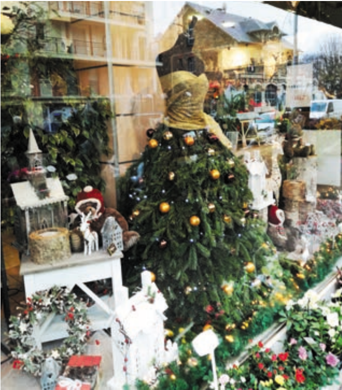
1 ER PRIX « VITRINE DES COMMERÇANTS » LES FLEURS DE RAYMONDE