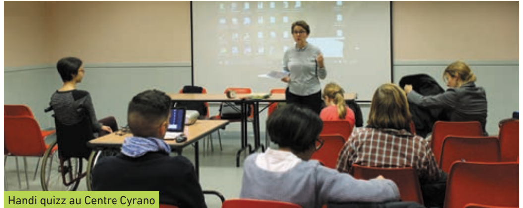
Handi quizz au Centre Cyrano