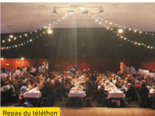
Repas du téléthon