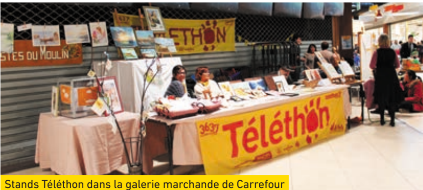
Stands Téléthon dans la galerie marchande de Carrefour