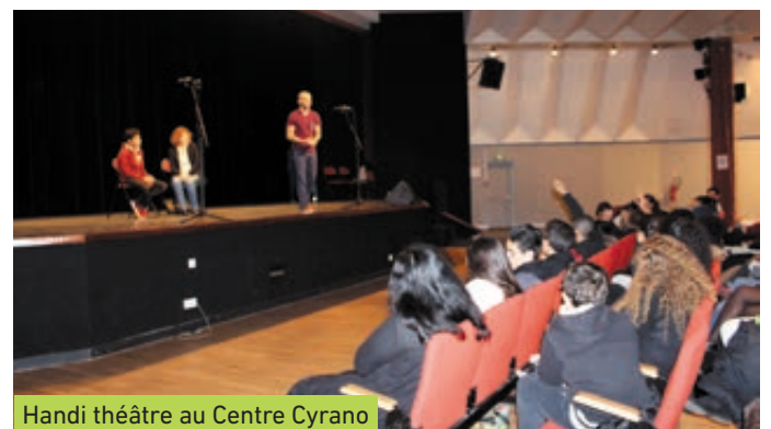
Handi théâtre au Centre Cyrano