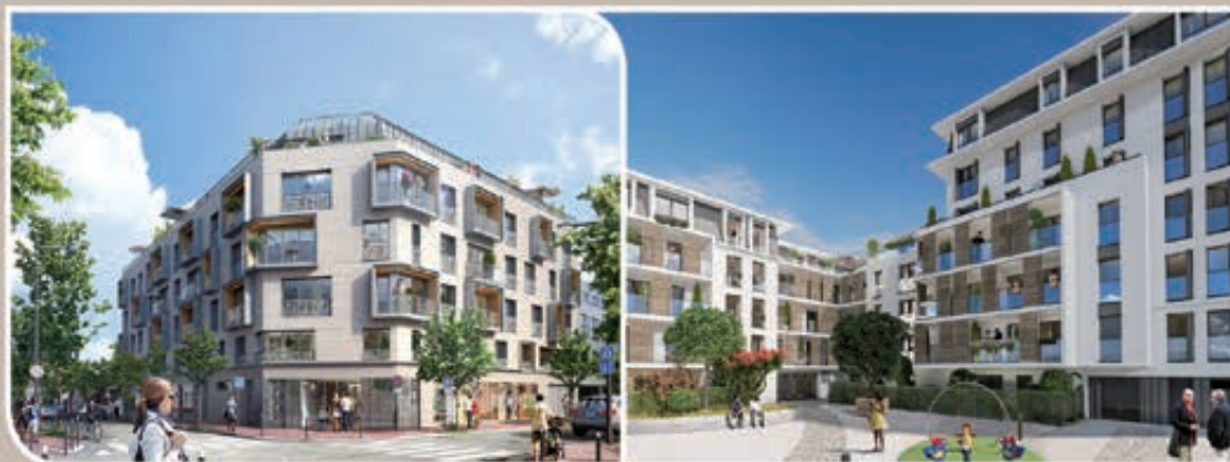
Le 10 Acacias - Issy-les-Moulineaux (92)

50 autres réalisations en Ile-de-France et en régions