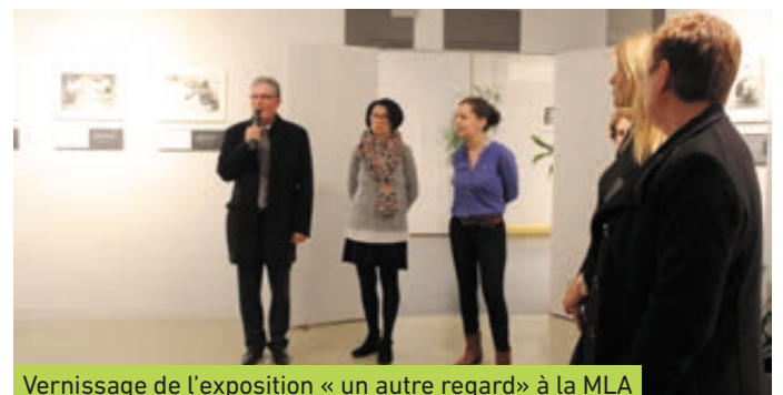
Vernissage de l'exposition « un autre regard » à la MLA