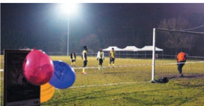
Foothon et handballthon