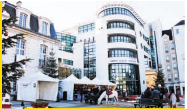
Animations des pompiers de Sannois sur le Parvis

De nombreuses animations étaient organisées dans la ville pour le Téléthon. Un grand merci à tous les bénévoles et donateurs pour leur engagement. Cette année 39 045 € (dont 6 045 € par les Pompiers du centre de secours de Sannois) ont été intégralement reversés à l'AFM dans la lutte contre les maladies génétiques.