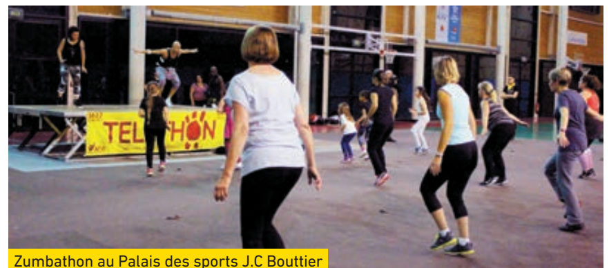
Zumbathon au Palais des sports J.C. Bouttier