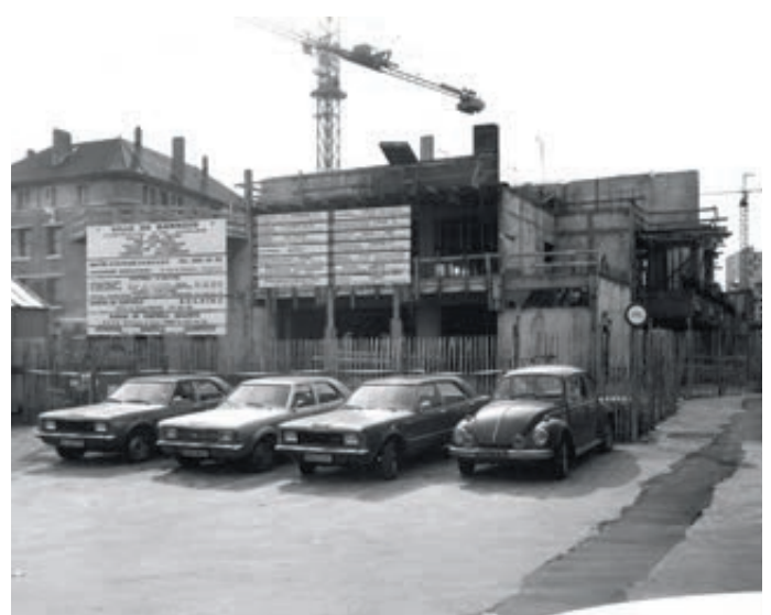
Mai 1976 – Le plancher du rez-de-chaussée en construction (archives municipales, cote 1Z165).