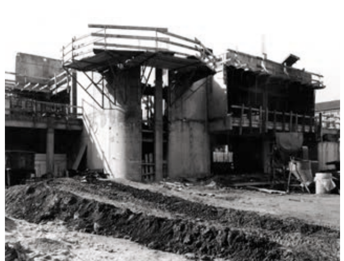
Septembre 1976 – Le 2 e étage de la médiathèque en construction (archives municipales, cote 1Z165).