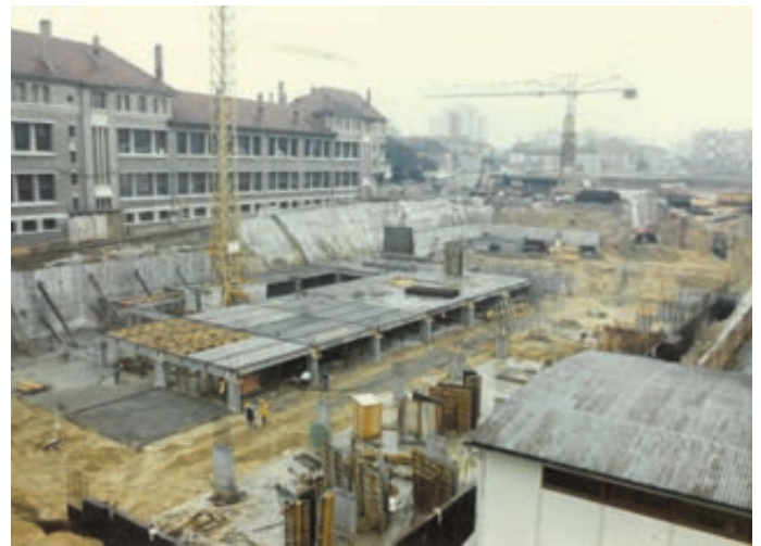
Février 1976 – Le plancher du 1 er sous-sol est en train d'être posé sur les piliers du 2 nd sous-sol (archives municipales, cote 1Z165).

La construction de ce bâtiment dessiné par l'architecte Delaporte débute en novembre 1975. Le terrain est rapidement dégagé et l'ancienne halle du marché détruite. Ainsi dès le mois de janvier, les fondations sont creusées et le béton commence à couler. La construction avance vite. Dès le mois de juin le plancher du rez-de-chaussée est achevé, terminant ainsi les parkings en sous-sol. L'édifice s'élève petit à petit et la charpente est posée début 1977. Le gros œuvre aura ainsi mobilisé de 30 à 40 ouvriers en moyenne sur le chantier. Durant toute l'année 1977 l'aménagement intérieur se poursuit. Cependant, le chantier prend du retard. L'inauguration du bâtiment, initialement prévue en décembre 1977, sera finalement décalée et s'effectuera officiellement le 23 mars 1978. Le chantier aura finalement coûté près de 27.500.000 F, mobilisé en permanence une soixantaine d'hommes pour l'aménagement intérieur et cumulé 24 jours et demi d'arrêt de chantier pour cause d'intempéries ou de fortes chaleurs.