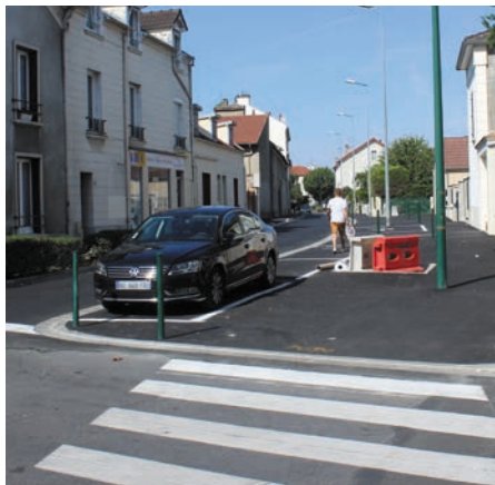
Aménagement de la rue Georges Keiser RD192. (Entre la rue du Maréchal Joffre et la rue Suzanne Valadon).