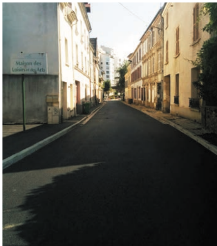
Réfection de la rue Victor Basch (entre la rue Jean Sancier et la rue du Puits Gohier).