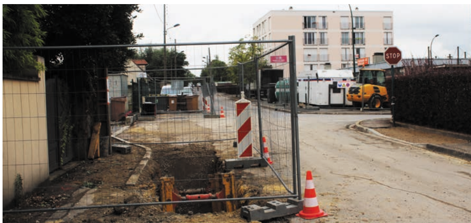
Réfection et aménagement de la rue du Poirier Baron (au croisement de la rue des Bergamotes).