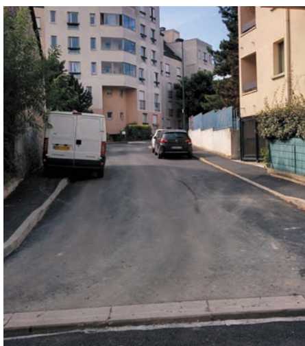
Aménagement de la rue Anne Frank (entre la rue Victor Basch et la rue du Docteur Alison).