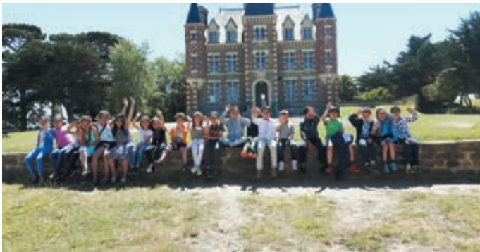
Les enfants ont mené la vie de château ! Ils ont logé dans le château du Nessay sur une petite presqu'île.

Ils se sont essayés à de nombreux sports et loisirs tels que : optimist (petit voilier solitaire), pêche à pieds, voyage en bateau jusqu'à Saint-Malo et découverte de la ville.