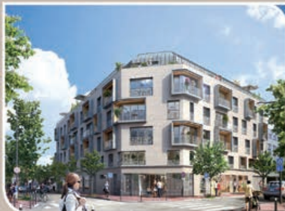
Le 10 Acacias - Issy-les-Moulineaux (92)

50 autres réalisations en Ile-de-France et en régions