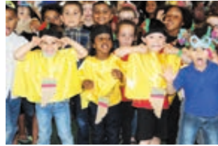
Beau concours de grimaces avant de « monter sur scène » pour le spectacle de fin de mois !