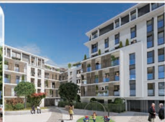
Villa Mansio - Maisons-Alfort (94)

Depuis sa création en 1989, Pitch Promotion conçoit et réalise des programmes immobiliers qui prennent en compte les nouvelles aspirations sociales et les besoins des entreprises.