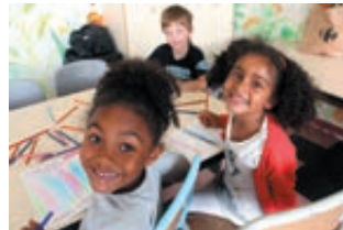
Les beaux sourires des Moussaillons