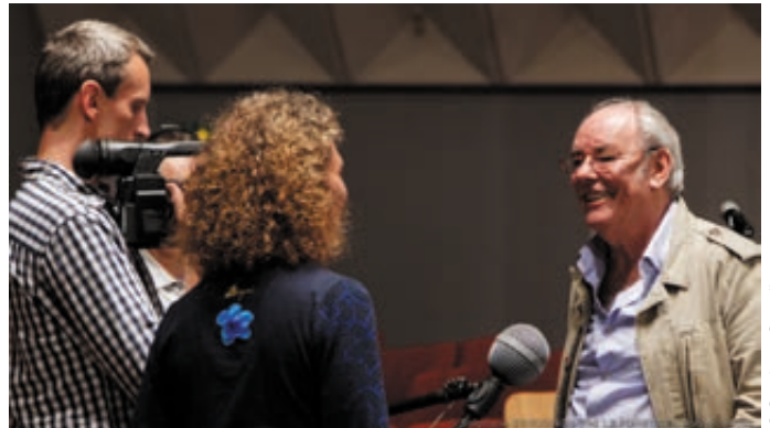
Maxime Le Forestier interviewé par France 3