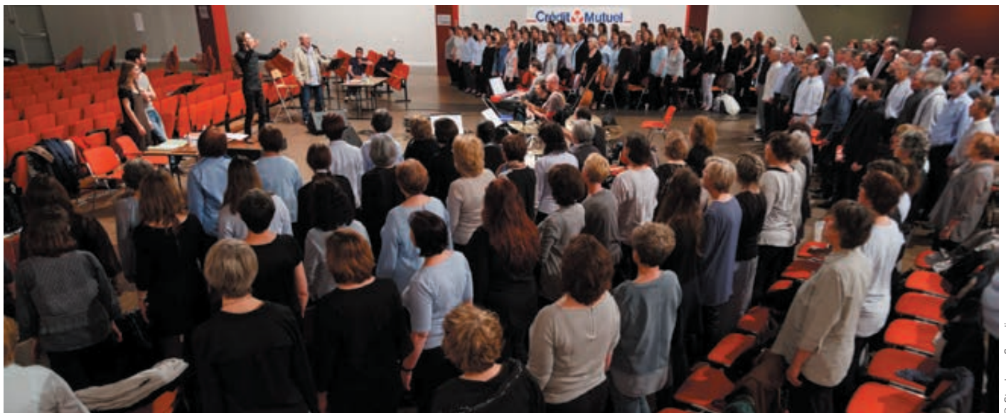
Répétitions avec l'ensemble des choristes