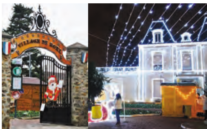
Entrée du square Jean Mermoz