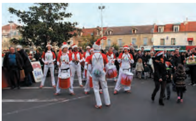
Une fanfare l'accompagnait le dimanche matin