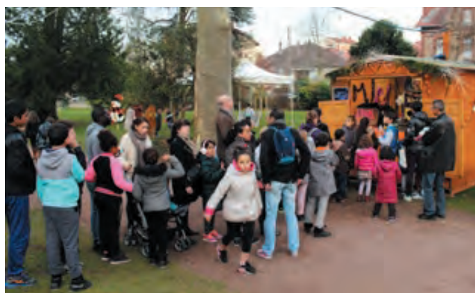
Les chalets du marché de Noël