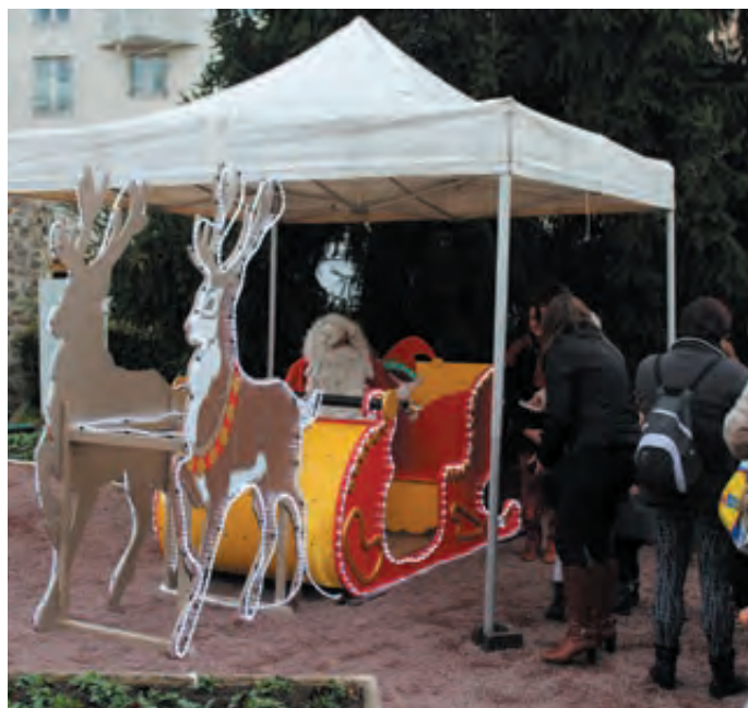
Le traîneau du Père Noël était installé à l'entrée du parc