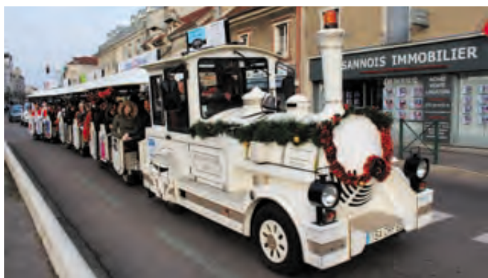
Tout le weekend, le petit train a parcouru la ville