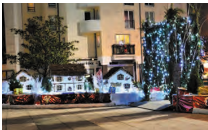
Illumination du parvis de l'hôtel de Ville de nuit