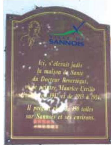
100 e anniversaire de la présence du peintre Maurice Utrillo à Sannois (17 avenue Rozée).

Les visites seront exceptionnellement jumelées avec celles des vignes et les visiteurs pourront, après leur visite, déguster le vin de Sannois. L'association Gospel « Chœur à chœur » se produira à 15 h 30.