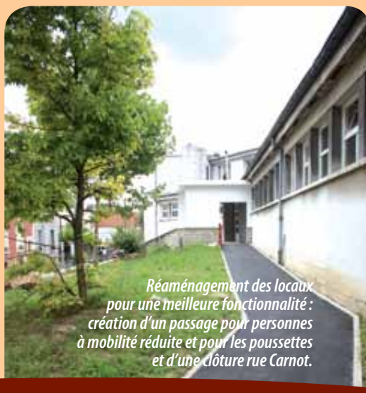
Réaménagement des locaux pour une meilleure fonctionnalité : création d'un passage pour personnes à mobilité réduite et pour les poussettes et d'une clôture rue Carnot.