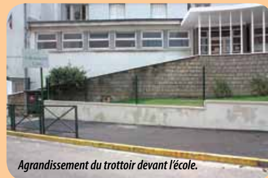
Agrandissement du trottoir devant l'école.