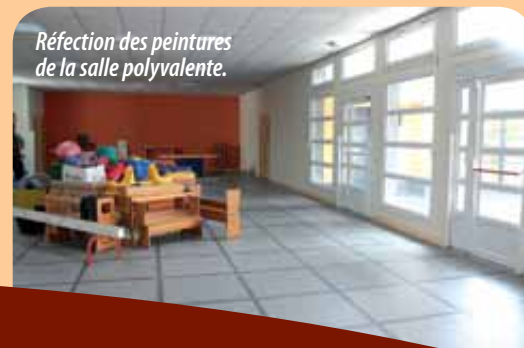
Réfection des peintures de la salle polyvalente.