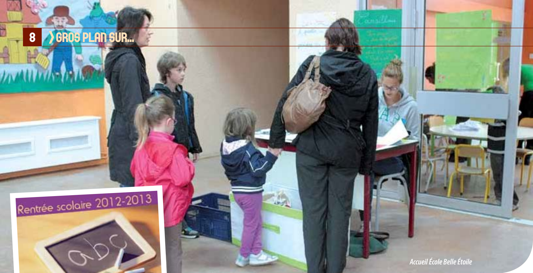
Accueil École Belle Étoile