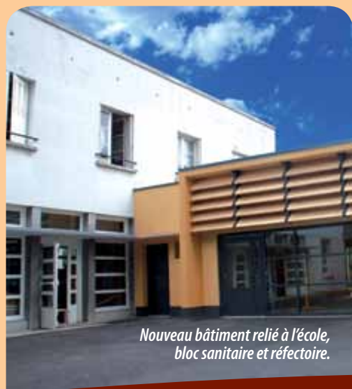
Nouveau bâtiment relié à l'école, bloc sanitaire et réfectoire.