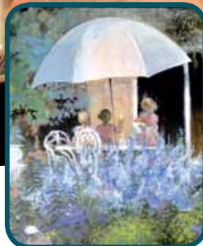
EXPOSITION ROUSSEAU- GROLÉE AU MUSÉE PAGE 11