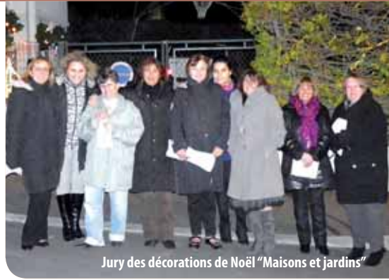
Jury des décorations de Noël "Maisons et jardins"

L'élection se fera lors d'un conseil de quartier dont la date sera communiquée ultérieurement. Les résultats seront transmis ensuite aux habitants par les moyens habituels (panneaux, site, journal...).