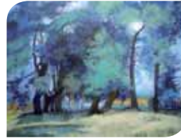
La terrasse (130 x 97 cm)

Musée Utrillo-Valadon - Place du Général Lederc - Du mercredi au dimanche de 10h à 12h et de 14h à 18h - Entrée : 1€.