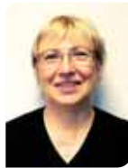
Coordinatrice Service des Conseils de quartiers