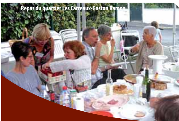
Repas du quartier Les Carreaux-Gaston Ramon

Vous pouvez aussi vous renseigner auprès du service des conseils de quartiers au 01 39 98 20 25 ou par courriel à politique.des.quartiers@sannois.org