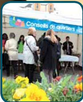
DOSSIER : CONSEILS DE QUARTIERS PAGE 8-9