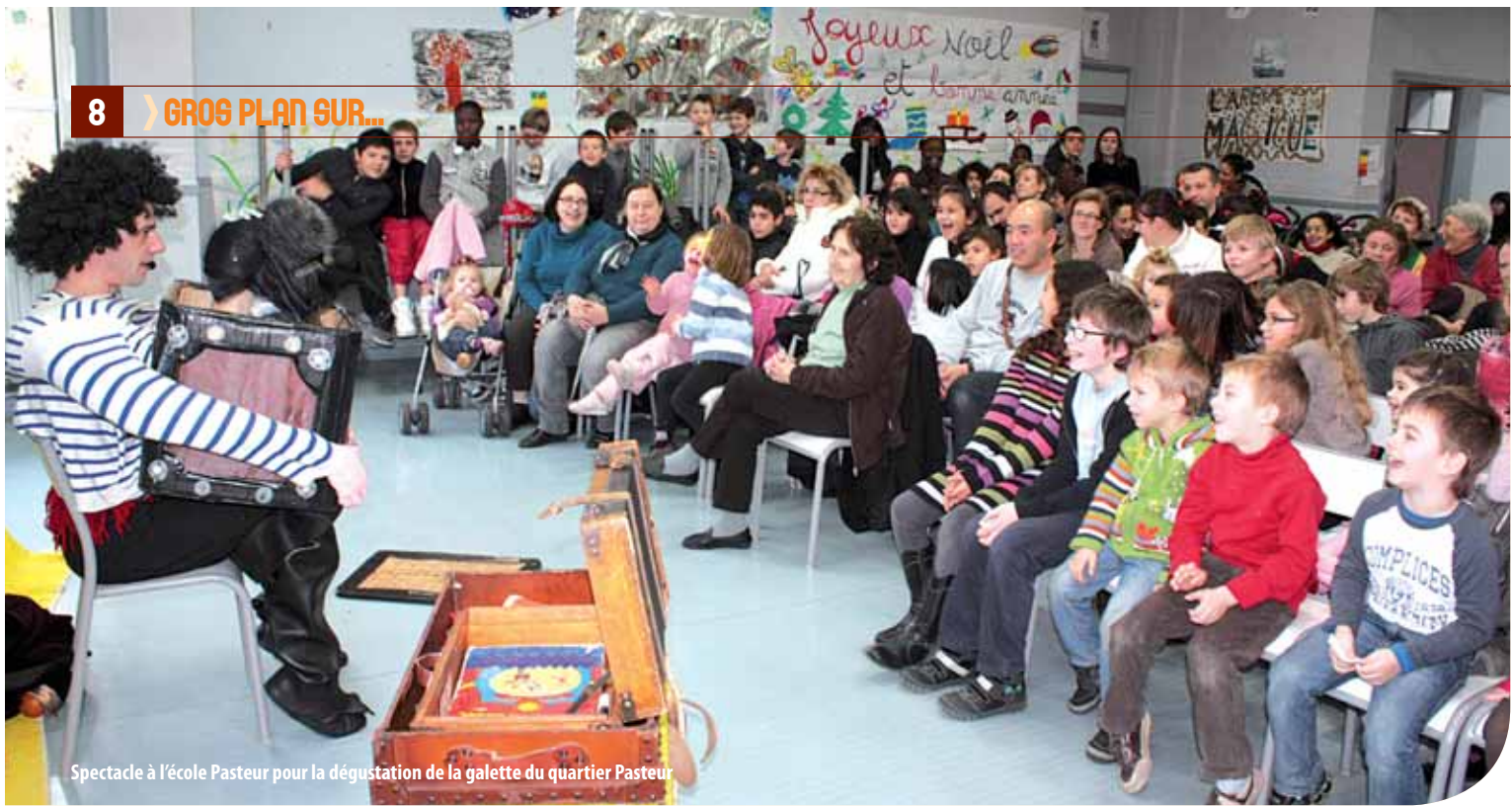
Spectacle à l'école Pasteur pour la dégustation de la galette du quartier Pasteur