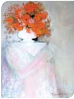
Bouquet à la nappe blanche (65 x 54 cm)