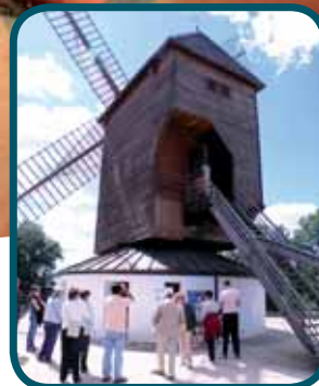
ANIMATIONS DU MOULIN PAGE 12