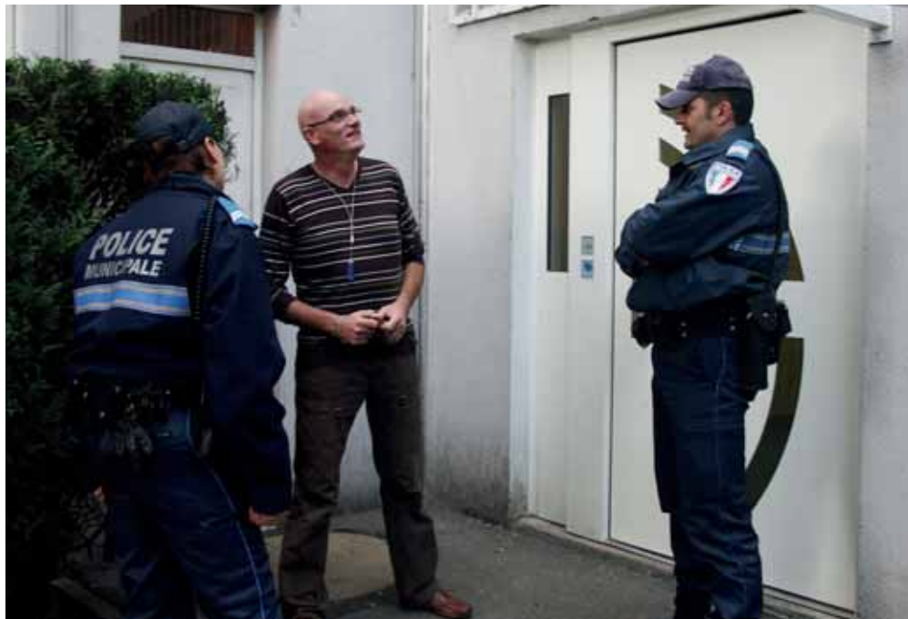
Les ilotiers en relation étroite avec les habitants, les gardiens d'immeuble, les commerçants et le tissu associatif

La prévention de la délinquance est efficace quand elle associe étroitement de nombreux partenaires, différents selon les thématiques. L'action au niveau local est primordiale. La politique de prévention contribue à la baisse durable de la délinquance