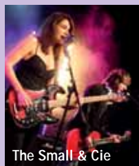
The Small & Cie