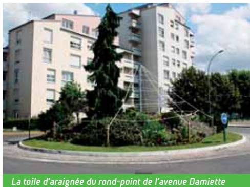
La toile d'araignée du rond-point de l'avenue Damiette

N e soyez pas étonnés de voir d'étranges insectes envahir les massifs de la ville ! En effet, le fleurissement de la ville respectera le fil rouge de la commune pour 2010 : « les insectes ». Des structures métalliques représentant des insectes seront installées à différents endroits :