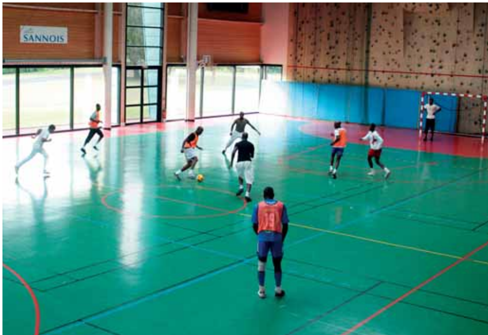
Les gymnases restent ouverts aux jeunes durant les vacances scolaires

vier 2010, la Ville attribue une aide financière à des associations sannoisiennes par le biais du Contrat Urbain de Cohésion Sociale (CUCS) pour proposer des actions dans les quartiers du Moulin, des Carreaux et des Buissons.