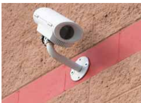
Etude pour la mise en place de vidéo protection

Dans le cadre des dispositifs de la politique de la ville, un financement est apporté à une action spécifique à destination des jeunes collégiens sur le thème de l'alternance. Les jeunes bénéficient d'un accompagnement pour pouvoir mener à bien leur projet.