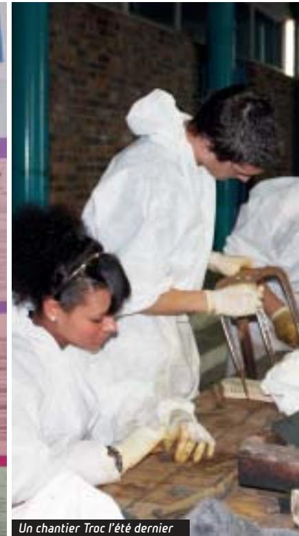
Un chantier Troc l'été dernier