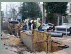
» Quartier Moulin Réfection de l'assainissement, rue Cassini.