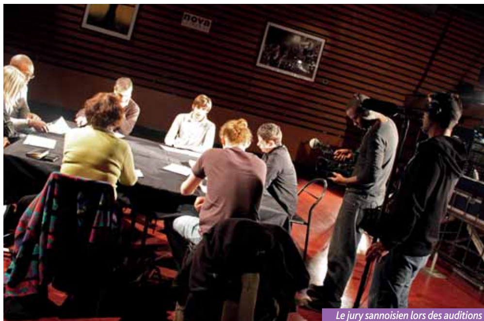
Le jury sannoisien lors des auditions

Little Sister nous livre une pop efficace : une guitare rythmique accrocheuse, dynamisée par une basse batterie au groove impérial, un sax endiablé et aérien, des claviers soignés et éclatants !