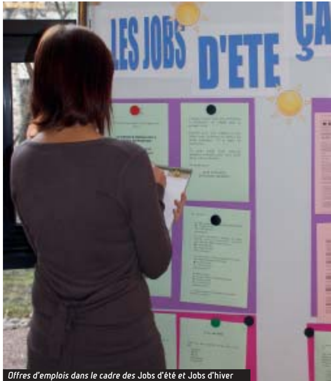
Offres d'emplois dans le cadre des Jobs d'été et Jobs d'hiver

Créé en 1999, le service Insertion-Emploi est un lieu d'accueil pour les personnes en recherche d'emploi.