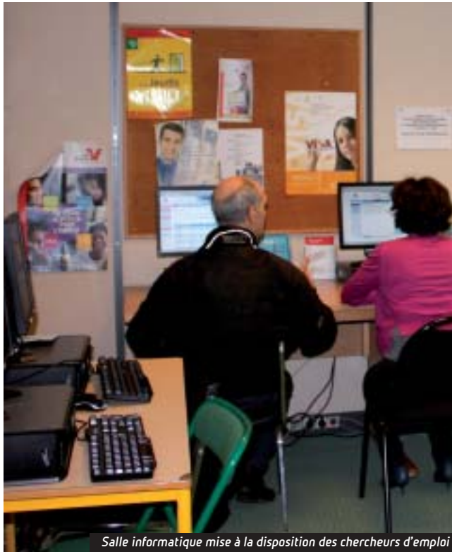
Salle informatique mise à la disposition des chercheurs d'emploi