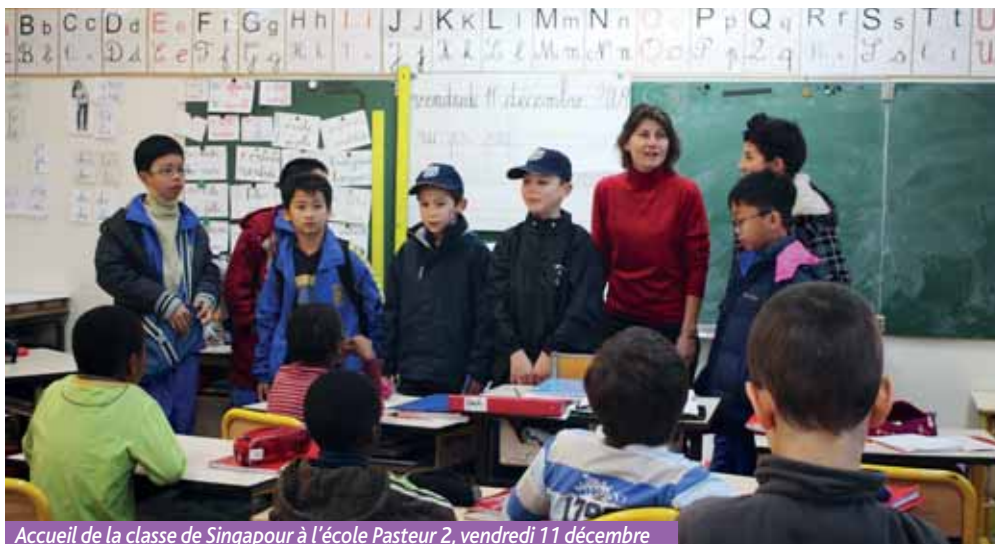
Accueil de la classe de Singapour à l'école Pasteur 2, vendredi 11 décembre

Les rencontres avec les sportifs locaux, les petites manifestations sportives ou les concours artistiques sur le thème du sport et de l'Olympisme organisés par l'enseignante, ainsi que les comptes-rendus de nombreux projets antérieurs réalisés avec les enfants, ont aussi joué un grand rôle dans la sélection de cette classe. ■