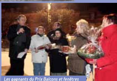
Les gagnants du Prix Balcons et fenêtres