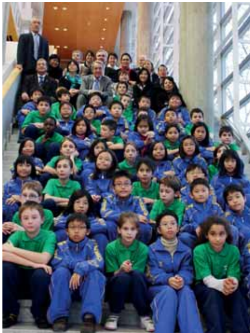
Jeudi 10 décembre, les élèves de Pasteur 2 ont rencontré leurs homologues de Singapour au Comité National Olympique et Sportif Français.