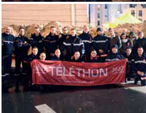
Longueurs de piscine - Loto - Escalade - Concert - Repas de gala - Vente aux enchères. Rien n'arrêta les Sannoisiens pour récolter des dons