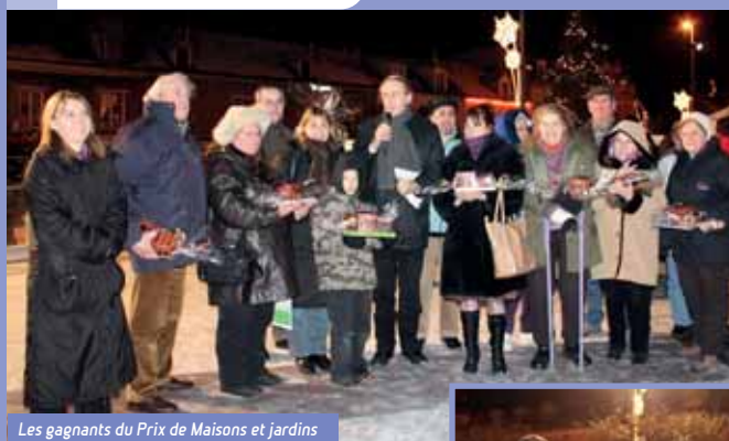
Les gagnants du Prix de Maisons et jardins