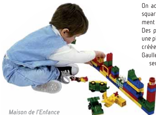
Maison de l'Enfance 123-129, bd du Général de Gaulle

Les enfants sont accueillis par tranche d'âge dans quatre unités de vie autonomes, d'une capacité de dix à quinze enfants, toutes équi-