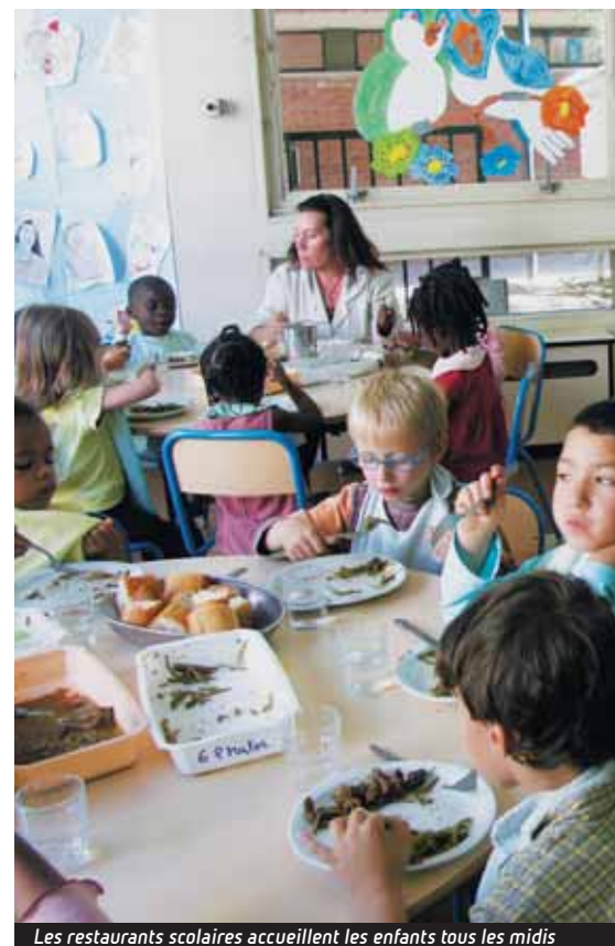
Les restaurants scolaires accueillent les enfants tous les midis