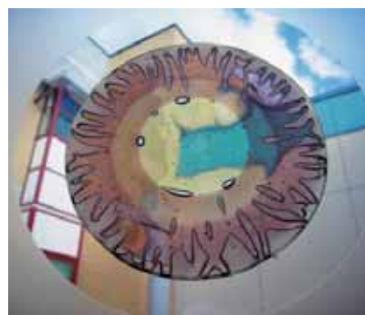
Exposition de Louise Watson