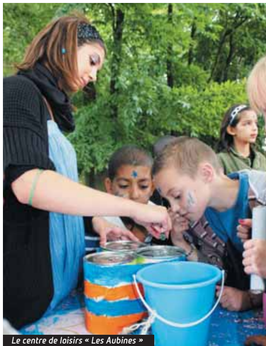
Le centre de loisirs « Les Aubines »