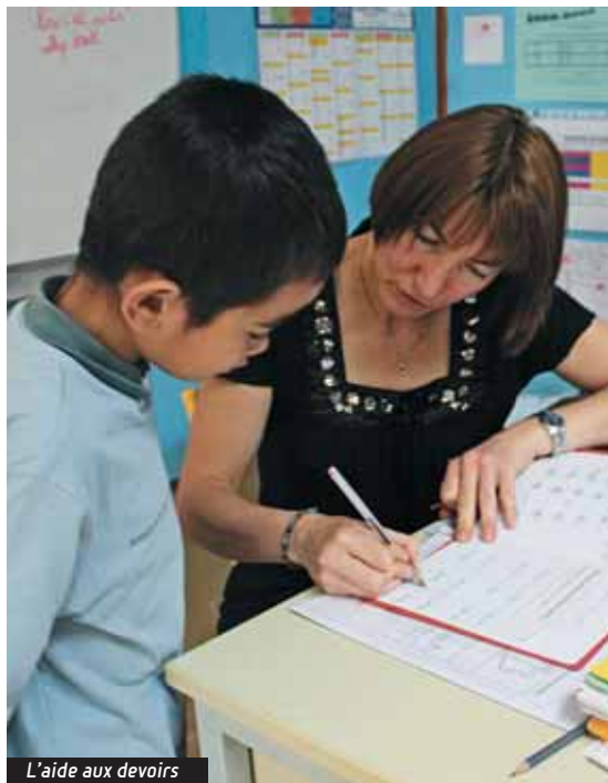
L'aide aux devoirs