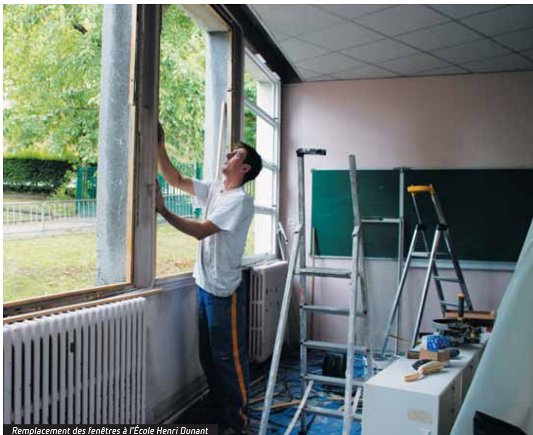
Remplacement des fenêtres à l'École Henri Dunant