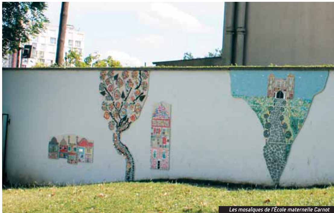
Les mosaïques de l'École maternelle Carnot