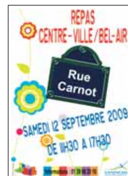
Repas de la rue Carnot