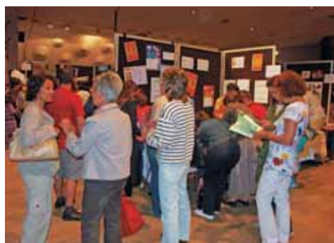
Forum des Associations et des loisirs