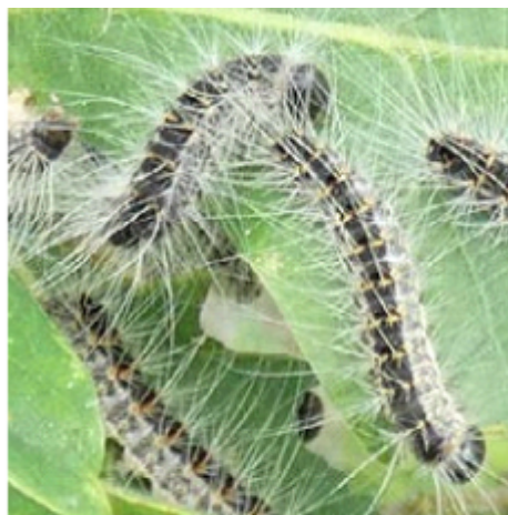
Chenille processionnaire du chêne