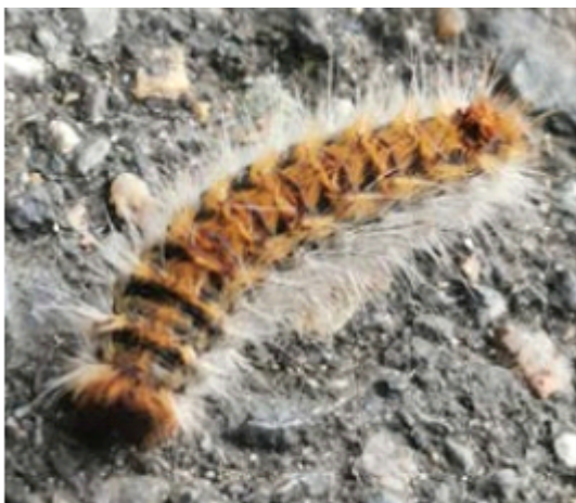
Chenille processionnaire du pin