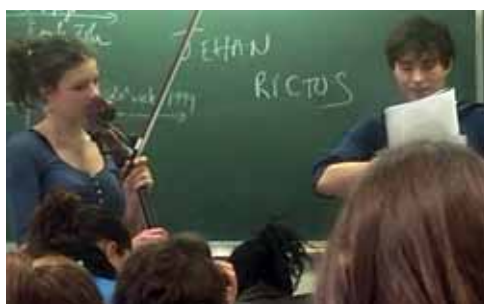
Le théâtre du Tricorne rencontre les collégiens.

Cette année, des artistes ont consacré un peu de leur temps de création aux jeunes