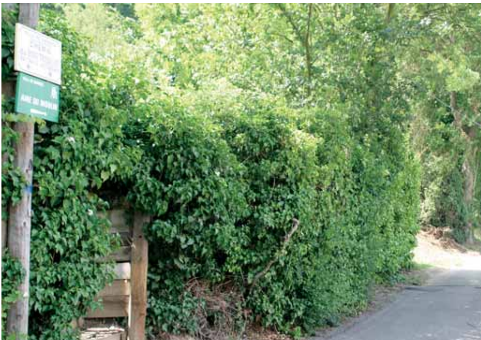
Le Parcours vert : le Chemin du Bois Trouillet en direction de l'Aire du Moulin.